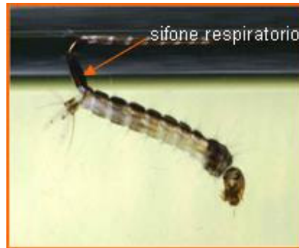
Fig. 3 3 larva di z. tigre