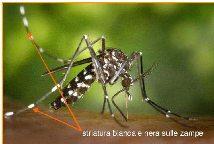
Fig. 1 1 zanzara tigre

Il nome z. tigre induce erroneamente le persone a pensare che la z. tigre abbia grandi dimensioni e una colorazione gialla-nera. Il nome si riferisce però alla sua aggressività.