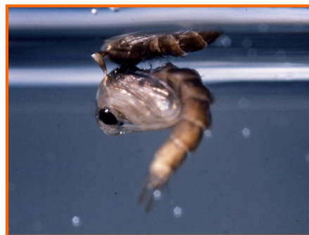
Fig. 4 3 pupa di z. tigre