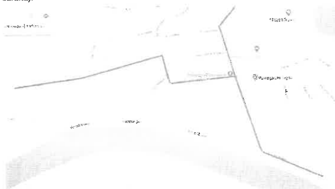
Figura 1 Cartina tratta da google maps (modificata)

I firmatari convengono sull'importanza di completare la realizzazione della Ciclopista percorso 31, ritenuta di importanza strategica sia per quanto riguarda la mobilità lenta dei cittadini, sia dal punto di vista turistico. La Commissione tiene tuttavia a indicare come la soluzione proposta non sia condivisa, in quanto ritiene il tracciato scelto poco logico rispetto alla funzionalità e all'economicità della ciclopista stessa. E questo a maggior ragione ora, se si pensa all'attuale progettazione del nuovo collegamento ciclopedonale fra Tegna e Verscio, che renderà comunque necessaria anche la realizzazione del collegamento, originariamente indicato dal Cantone, lungo via Patriziale (vedi cartina).